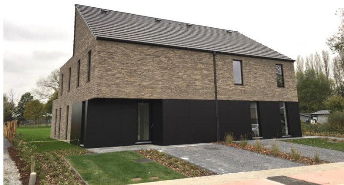
Potestraat 45-47, 3020 Herent

Vp construct bouwde in de driehoek tussen Leuven – Mechelen – Brussel twee hoogkwalitatieve prachtige villa's met een strakke moderne vormgeving op een zeldzaam groot terrein van 15 are elk. De woningen worden omgeven door weldadig veel groen en een rustgevend en ongerept landschap van weilanden en bossen. De lange smalle gevelstenen en gevelpanelen geven deze villa's een fris en zeer modern gevoel. De zwart aluminium ramen en een vlakke, donkerkleurige dakpan maken de buitenkant volledig af. Grote glaspartijen over de volledige lengte van de naar de tuin gerichte gevel halen het hele jaar door de natuur en veel licht in huis. Deze unieke villa's beschikken op het gelijkvloers over een ruime leefruimte, aparte bureauimte, zeer moderne keuken, een grote berging en bijkeuken. Verder beschikken de woningen bovenaan over 3 kamers waaronder één luxueuze masterbedroom met ruime dressing en een luxueuze badkamer met bijzonder groot meubel. Een vaste trap brengt u naar een schitterende extra polyvalente ruimte. Voor de kinderen of gasten is er een tweede badkamer voorzien met douche en meubel. Deze riante woningen bieden dat tikkeltje meer. Dit is de ideale plek om te genieten van de natuur en de rust. De gemoedelijkheid in de omgeving zal je zeker bevallen. De ideale buurt voor de kinderen, buiten 'ravotten' is zeker geen probleem met deze grote aangename tuin.